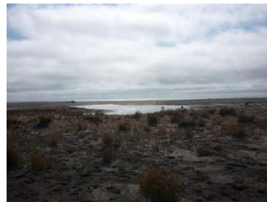
Figura 5: Vista desde el Sur hacia punta Toro en el fondo (felcha), tomada en marzo de 2010, quince días después del tsunami. Se puede apreciar la vegetación arrasada y la arena depositada por la inundación. La vegetación se quemó debido a la salinidad del agua de mar.