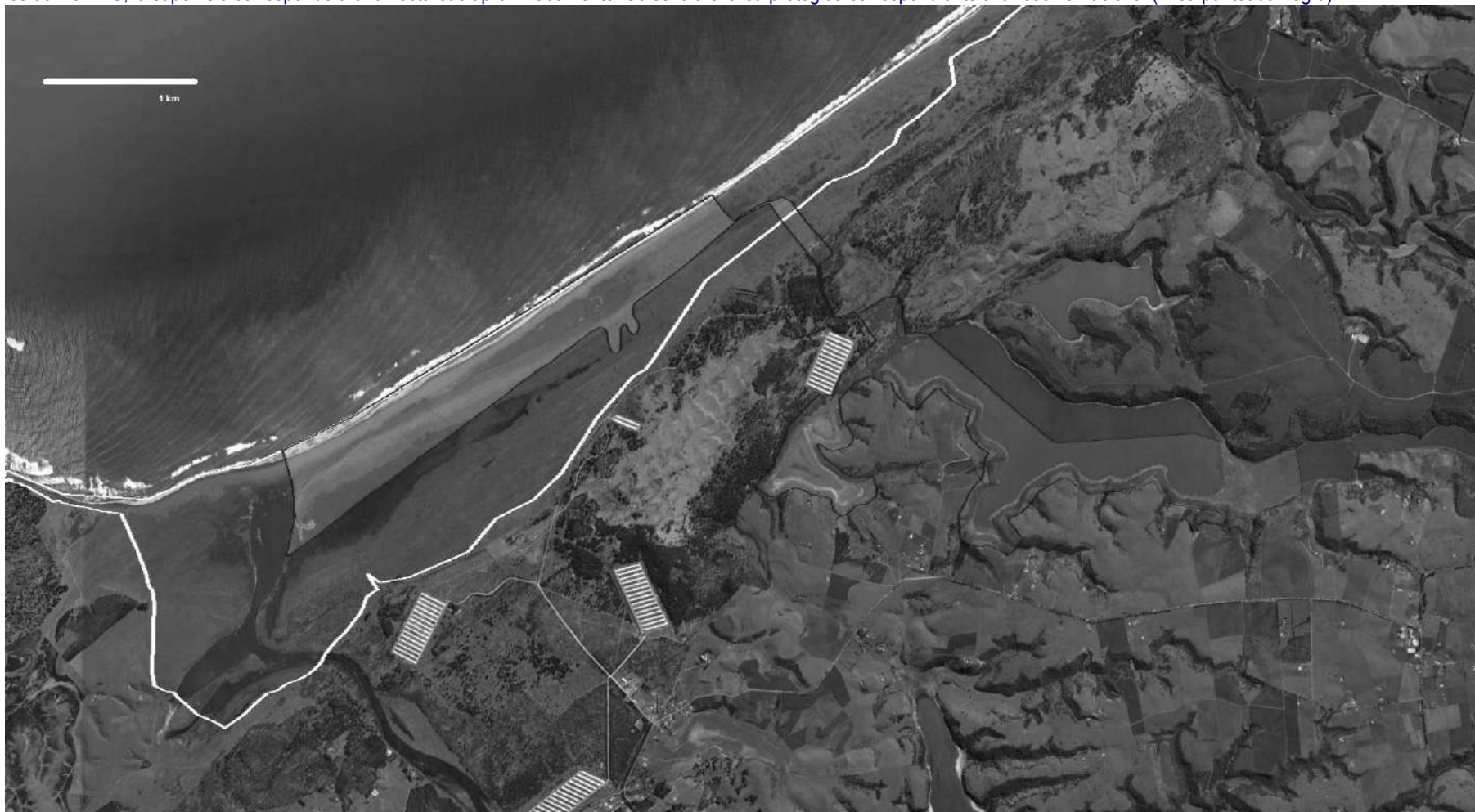
Figura 9: Área de inundación estimada (línea continua blanca) para la madrugada del 27 de febrero de 2010 en el arco de playa de 10 km de longitud que va desde los 33°45'56"S a los 33°43'44"S, la superficie corresponde a 840 hectáreas aproximadamente. Se señala el área protegida correspondiente a la reserva nacional (línea punteada negra).