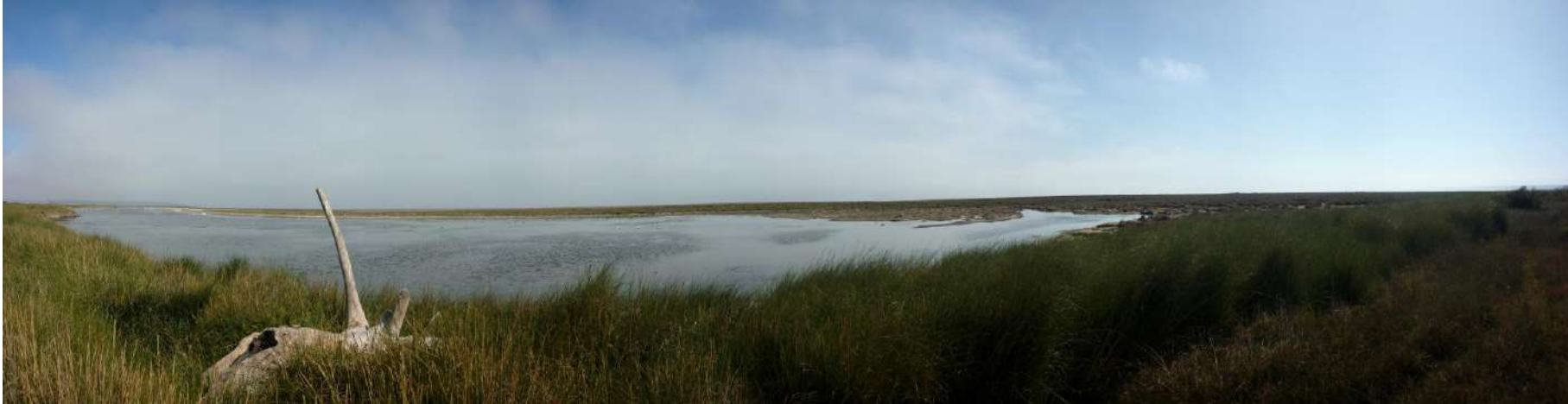
Figura 7: Vista panorámica desde el noreste de la Albufera en marzo de 2011, un año después del evento. Se aprecia la recuperación de la cubierta vegetal, pero la escasa recuperación de la duna costera. En primer plano se observa los restos de un árbol depositado por el tsunami.