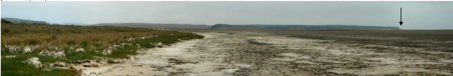
Figura 8: Vista panorámica del sector sur de la Albufera en marzo de 2011, un año después del evento. Esta sección era parte de la antigua laguna costera pero que debido a la falta de la duna cambió su dinámica a un cuerpo de agua que se inunda en las más altas mareas de sicigias y se seca completamente en los periodos de cuadratura. Al fondo se aprecia punta Toro (flecha).