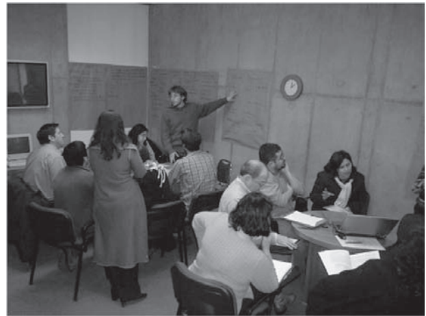
Sesiones de Brainstorming del proyecto ECOManage, región de Aysén. En esta participaron agentes de gobiernos (DGA, CONAF, CONAMA), académicos de diversas casas de estudios y estudiantes de postgrado, de diversas disciplinas, con trabajos de tesis en la Región de Aysén.

Desde nuestra perspectiva, el manejo integrado de ecosistemas es hoy una de las mejores opciones para la conservación y uso sustentable de los recursos naturales (Marín y Delgado, 2005). Este tipo de manejo como lo demuestra el proyecto ECOManage, incorpora la participación ciudadana como elemento fundamental, además del concepto de adaptabilidad,