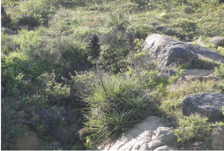
Figura 5: Hábito de Puya chilensis .