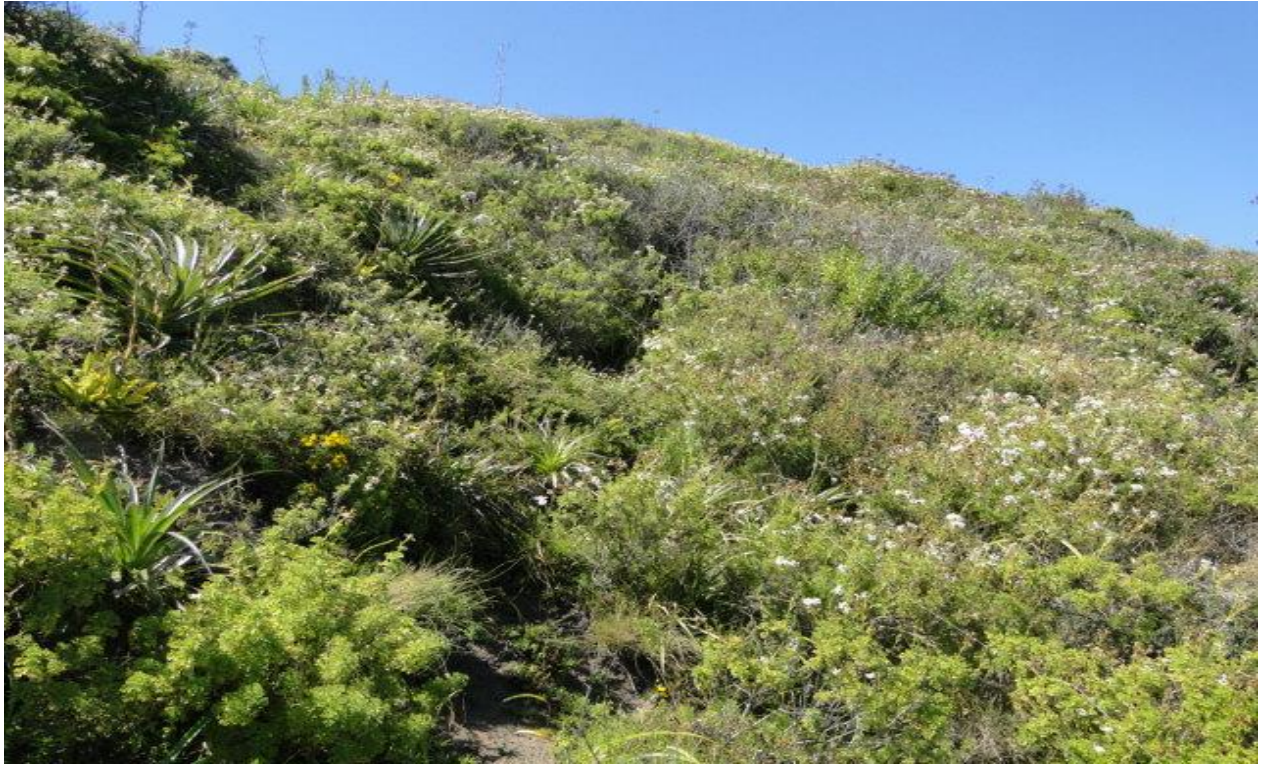
Figura 3: Matorral estepario del secano costero con una gran riqueza florística.

fimbriata , que recuerda la flora costera de más al norte incluso en periodos favorables a la prolongación del desierto florido. (Fig. 3).