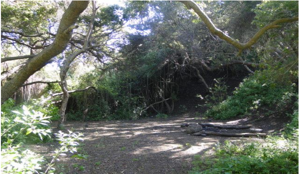
Figura 2: Interior del bosque esclerófilo costero de Molle-Lilén.

UV1.- Bosque esclerófilo costero de molle y lilén: Unidad de vegetación casi pura de individuos altos de Schinus latifolius , acompañado de Azara celastrina , ubicado al Nor-Este del campo dunar, muy singular y escaso en la región. Se sitúan en el algunas especies de sombra y humedad como Cissus striata y Cassia stipulacea . Se trata de una etapa sucesional de los bosques costeros de Peumo–Molle, que hace más singular todo el sistema dunar y las laderas vegetadas adyacentes (Fig. 2).