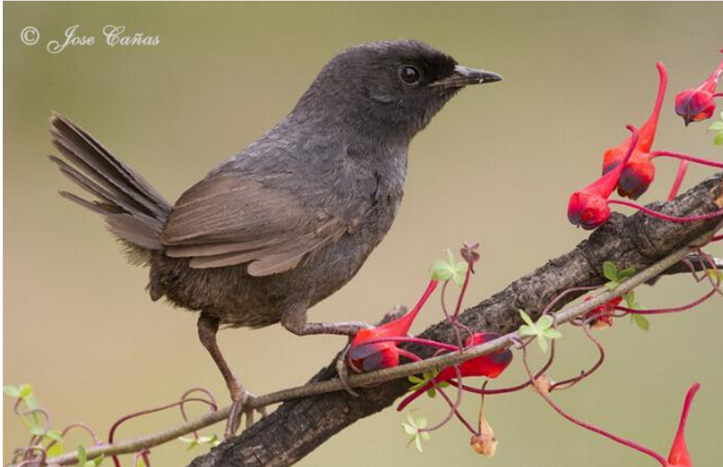
Ejemplar adulto de churrín ( Scytalopus fuscus ).