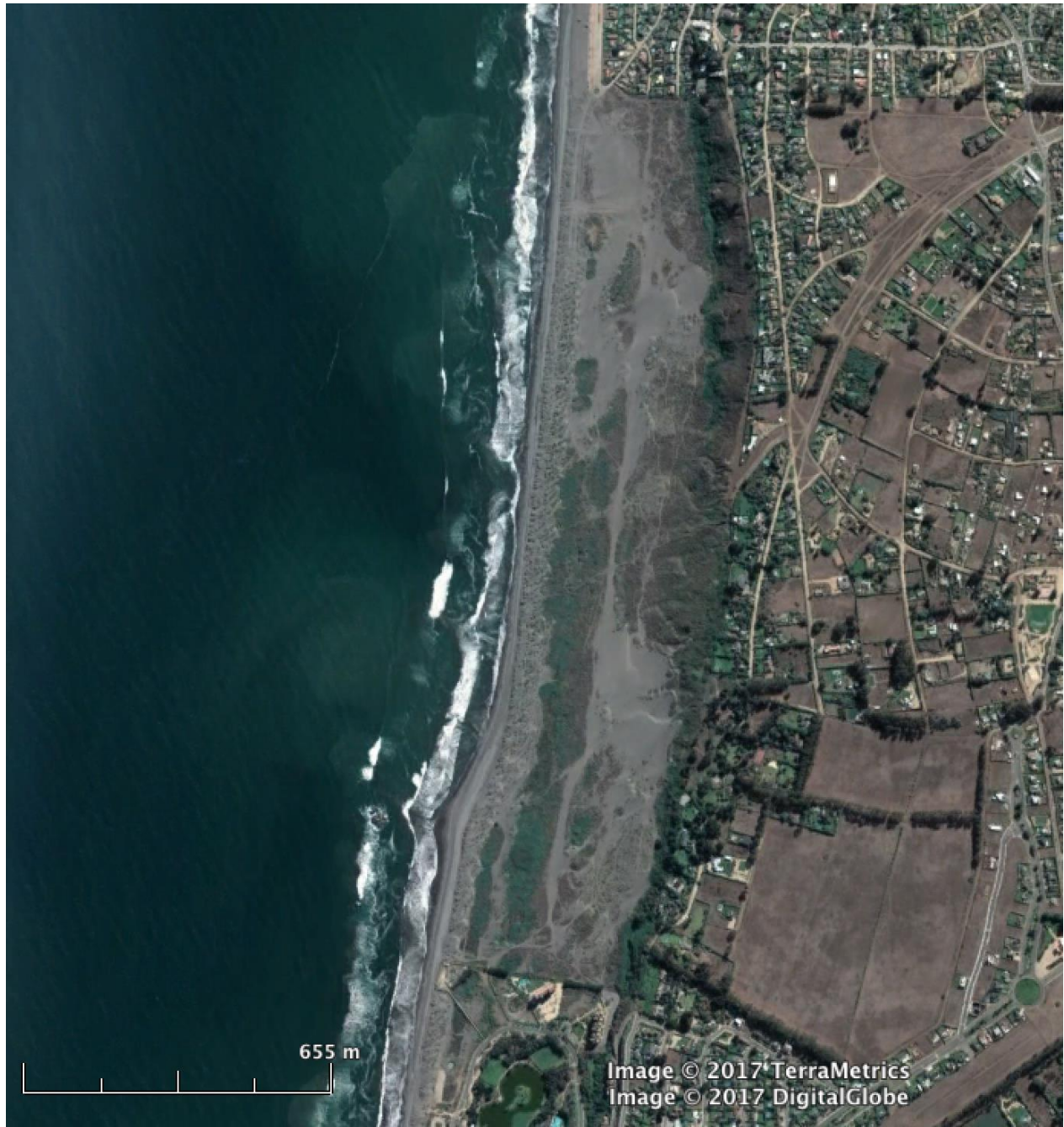
Figura 1. Imagen del campo dunar de la playa de Santo Domingo.

Durante el recorrido de las áreas de estudio, se realizó un catastro de las especies observadas y/o escuchadas realizando observaciones a ojo desnudo, con binoculares 10x42 y reconocimiento de las vocalizaciones, de esta manera se registró la totalidad de las especies presentes en el área durante el monitoreo. Para identificar la presencia de especies