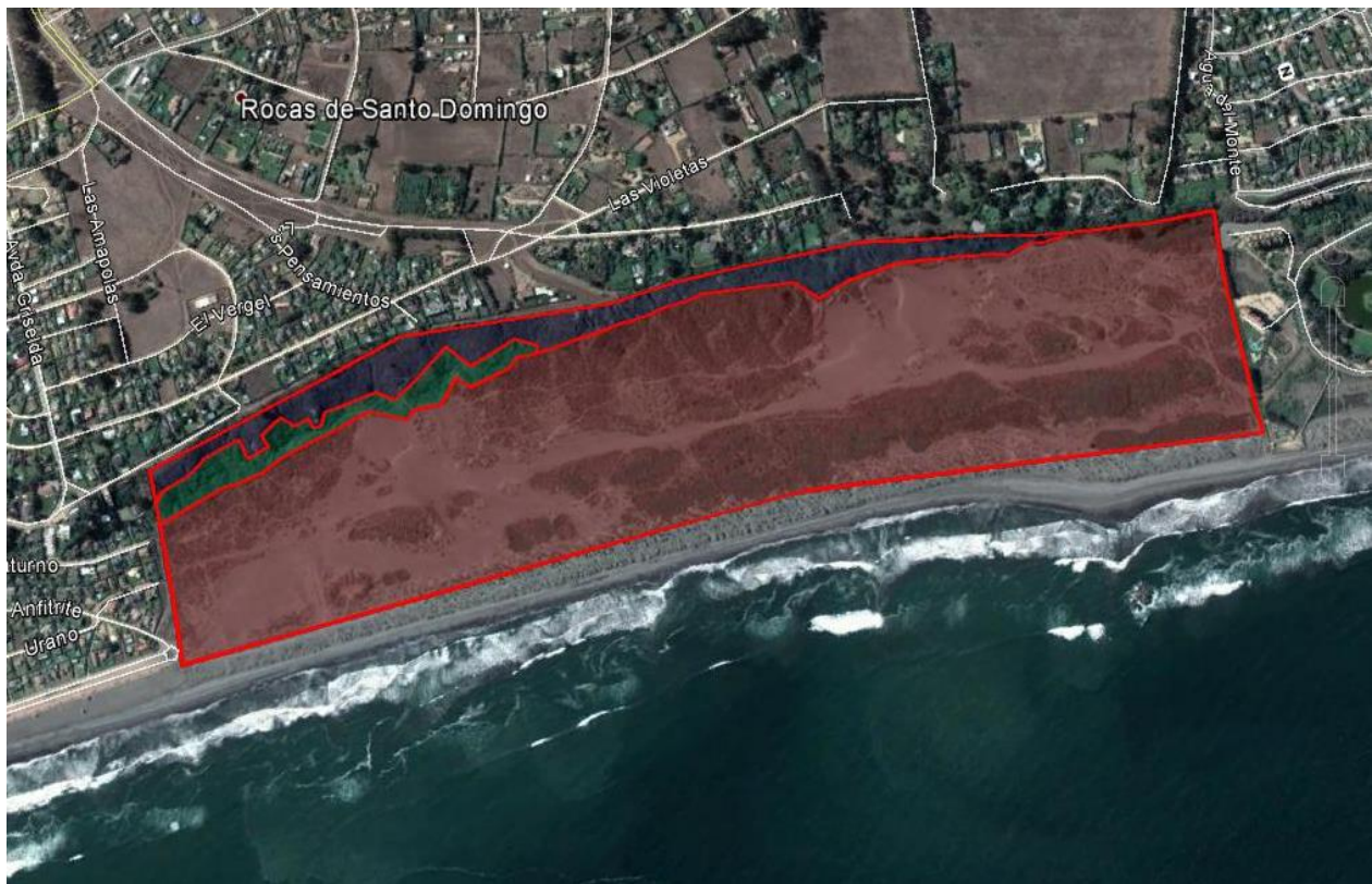
Figura. 1: Fotografía aérea con la delimitación del área de estudio, En Verde UV1: Bosque esclerófilo costero; en Azul UV2: Matorral estepario del secano costero y en Rojo UV3: Matorral dunar. Modificado de Google Earth ©.

El Sector se presenta como un terreno plano con escasa pendiente con suelo arenoso-arcilloso correspondiente a la zona de dunas pleistocénicas con diversos estados de sucesión ecológica y con diversas comunidades, algunas de ellas muy degradadas por el tránsito de vehículos motorizados. Al Norte se encuentra una pequeña quebrada con especies representativas del Bosque esclerófilo costero colindante con matorral estepario del secano costero en la ladera norte de la quebrada, con pendientes más o menos pronunciada y al sur del se ubican también, pequeños parches aislados de matorral de Schinus polygamus , Baccharis macraei y Haploppapus uncinatus (Fig.1).