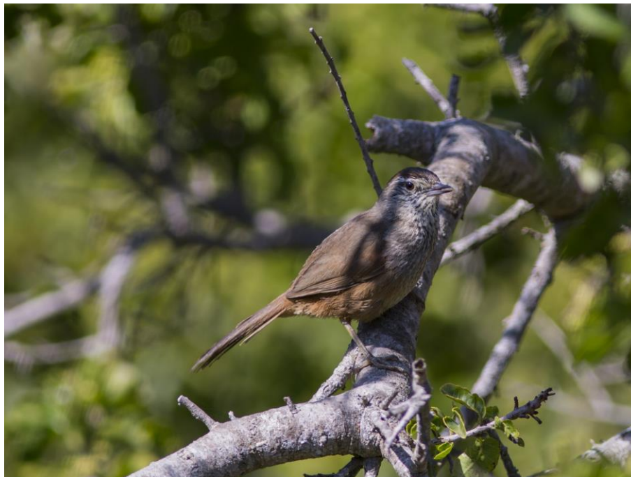
Ejemplar adulto de canastero ( Pseudasthenes humicola ).