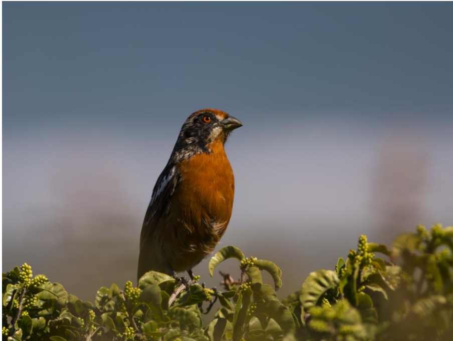
Ejemplar macho de rara ( Phytotoma rara )