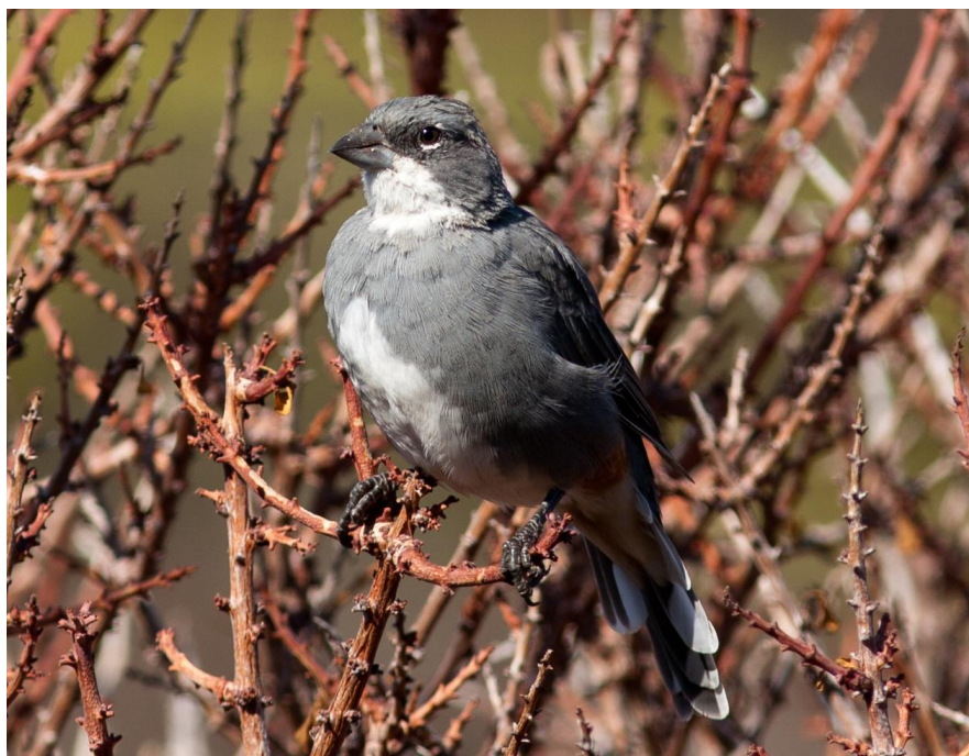
Ejemplar de diuca ( diuca diuca ).