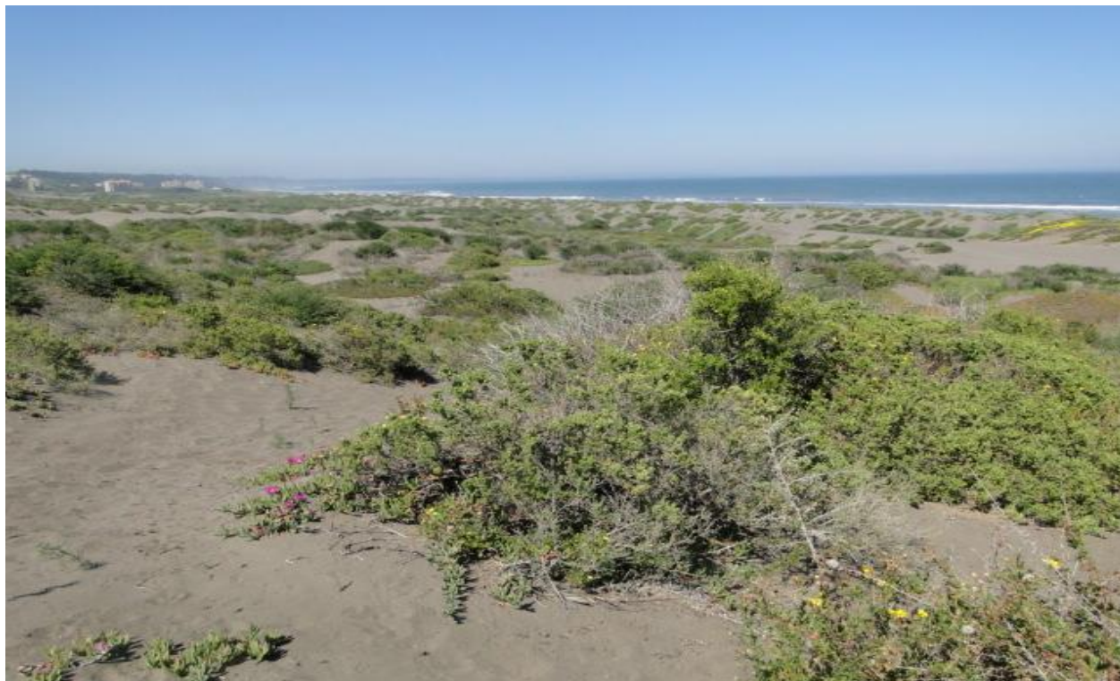
Figura 4. Matorral dunario, donde se observa doca y vautre, dominantes en el sector.