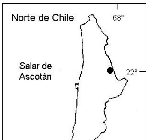
FIGURA 1. Ubicación geográfica del salar de Ascotán en el norte de Chile.

El clima del área de estudio corresponde a uno de tendencia tropical (Di Castri & Hajek 1976) y presenta un importante grado de aridez, ya que las precipitaciones, de acuerdo con los datos de la estación climática más cercana (Ollagüe), alcanzan en promedio sólo a unos 80 mm. Las precipitaciones se concentran principalmente en el período correspondiente al verano, aunque también se pueden registrar precipitaciones sólidas (nieve y granizo) durante el período invernal.